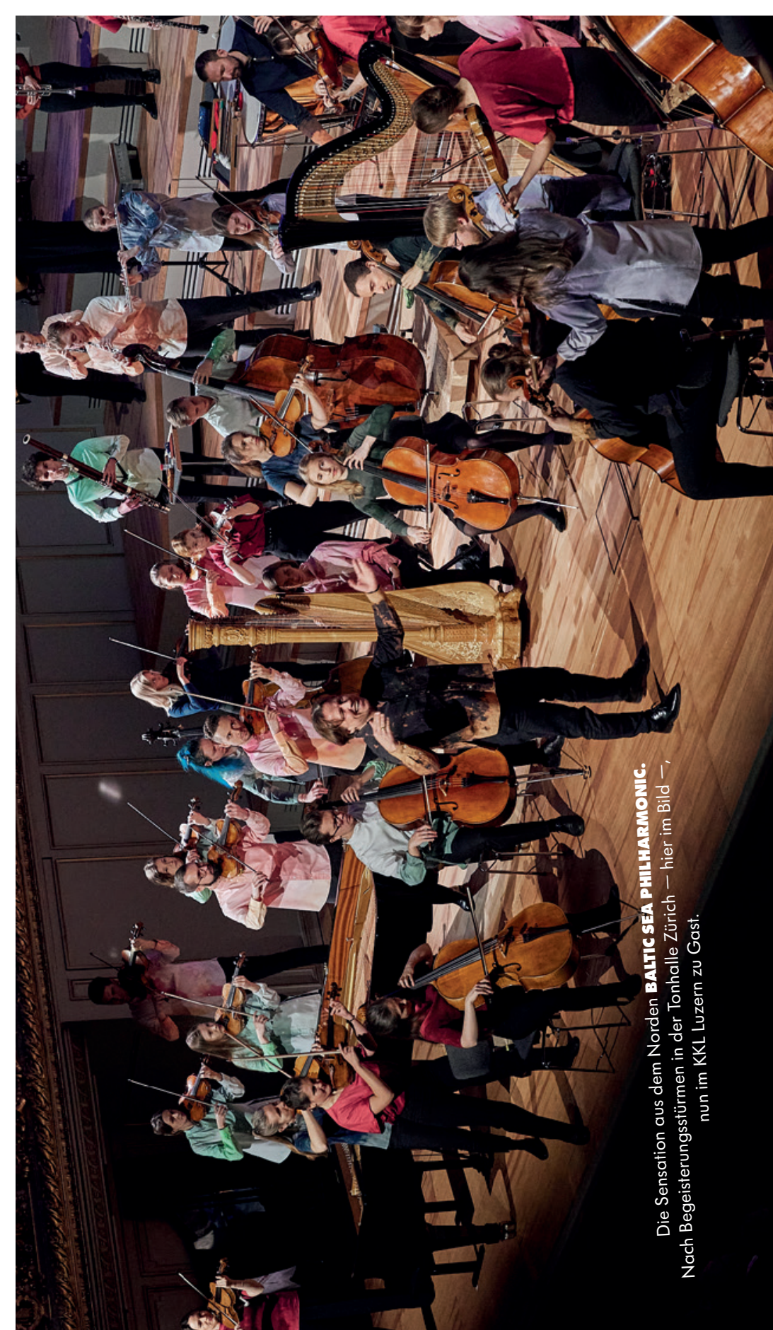
Die Sensation aus dem Norden BALTIC SEA PHILHARMONIC . Nach Begeisterungstürmen in der Tonhalle Zürich — hier im Bild — nun im KKL Luzern zu Gast.